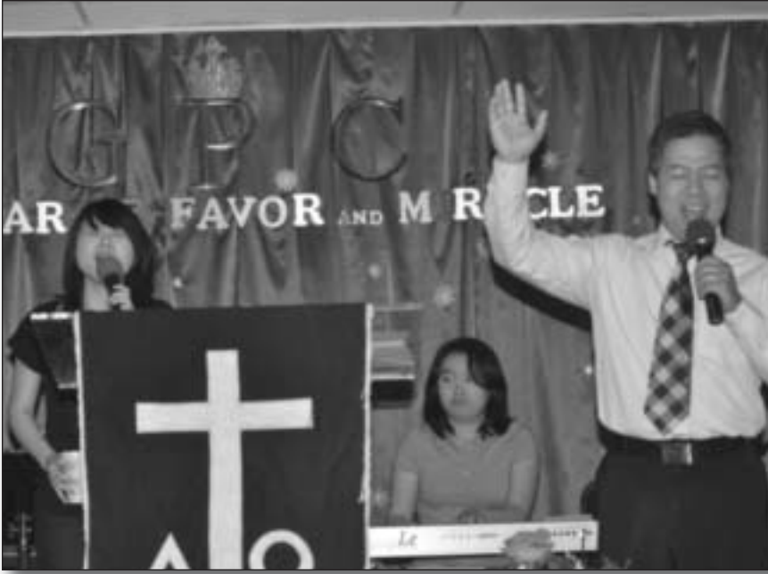
Chúa Nhật thờ phượng, lúc 10 am.

tôi có dịch vụ của chúng tôi nửa đêm ngày thứ Tư tại Atlanta và vào thứ Hai ở Jonesboro . Chúng tôi cũng có dịch vụ nhà thờ hai lần một tháng ở Macon, hai giờ đi từ Atlanta . Chúng tôi tin là có sức mạnh khi mấy người của Chúa cùng nhau cầu nguyện !