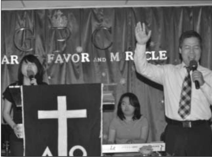
Servicio el Domingo a las 10 am.

media noche cada miércoles en Atlanta y los lunes en Jonesboro. Tenemos también servicios dos veces al mes en Macon, a dos horas de Atlanta. Creemos que hay poder cuando el pueblo de Dios oran juntos!